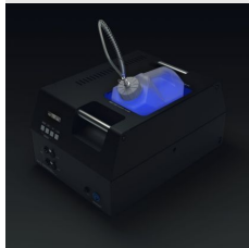
FUNKIT ELIF 100PROFILVKT1 IS NOT INCLUDED