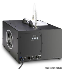
Fluid is not included