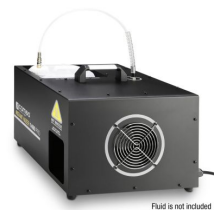
Fluid is not included