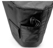
Cable is not included

Volksbank RheinAhrEifel IBAN: DE47 5776 1591 0358 0215 00 BIC: GENODE1BNA